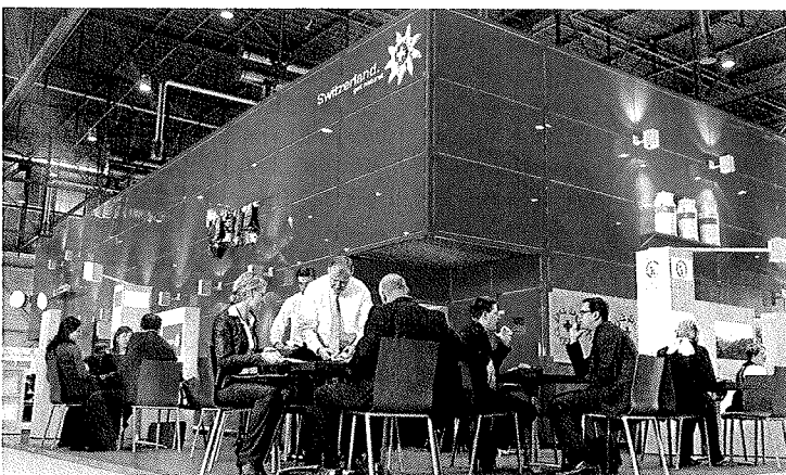
Angeregte Gespräche bei der diesjährigen STM

Vom 28. bis 30. Mai war Genf Austragungsort der größten Incoming Fachmesse der Schweizer Tourismusbranche - des Switzerland Travel Mart (STM). Die im Zweijahres-Rhythmus stattfindende Fachmesse wurde heuer zum 16. Mal abgehalten. An dem Wochenende fanden sich neben 370 nationalen Ausstellern, darunter unter anderem regionale Tourismusverbände, Hotels und Hotelgruppen, auch 450 internationale Besucher aus über 40 Ländern in der Stadt